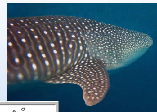
Mimi & G!!

C'est avec la tête encore pleine de mini-bulles, de paysages fabuleux et autres souvenirs que nous "surfons" doucement sur les premiers frimas de l'hiver.