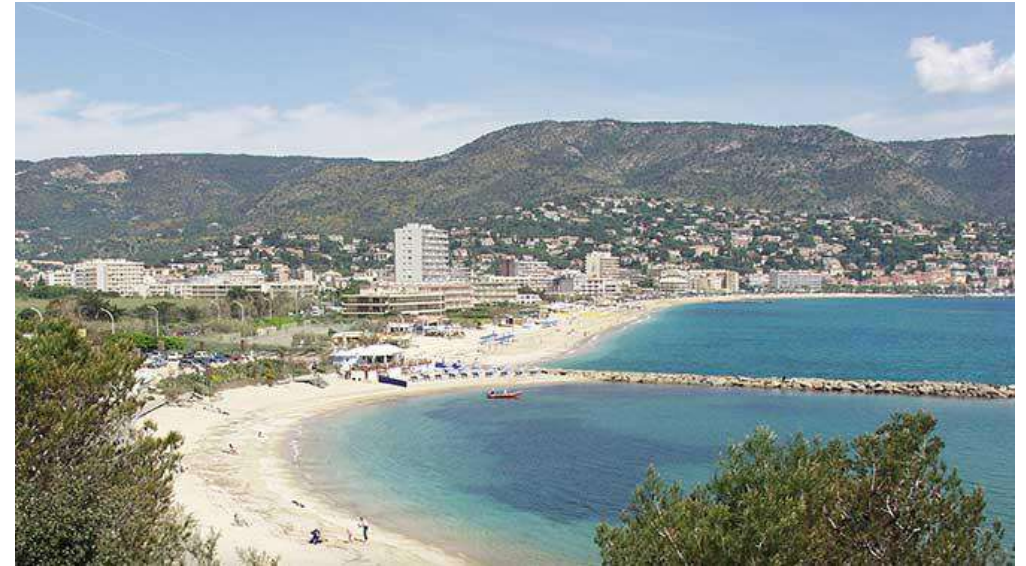
L'équipe de Lavandou Plongée

L'équipe de LAVANDOU PLONGEE se compose de :